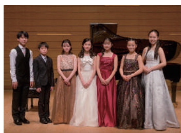
ピアノコンサート