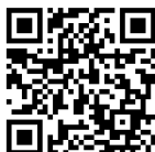
(1) 会員登録のご案内 (入会案内)