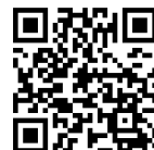
(3) プライバシーポリシー