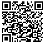
(2)申し込みフォーム