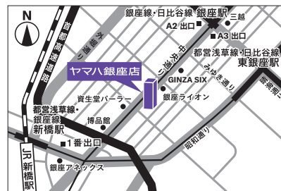
写真: ヤマハ銀座コンサートサロン

https://retailing.jp.yamaha.com/shop/ginza